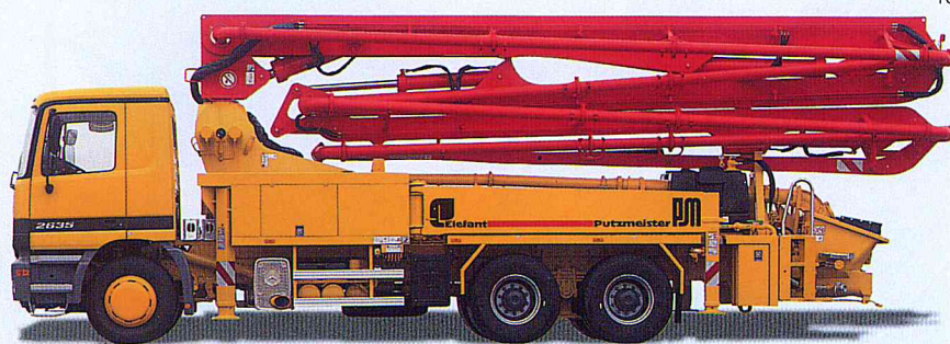
Longitud total: aproximadamente 11,31 m

Todos los datos son máximos teóricos. * Valores con aplicación de la presión en el lado del fondo de los cilindros de accionamiento.